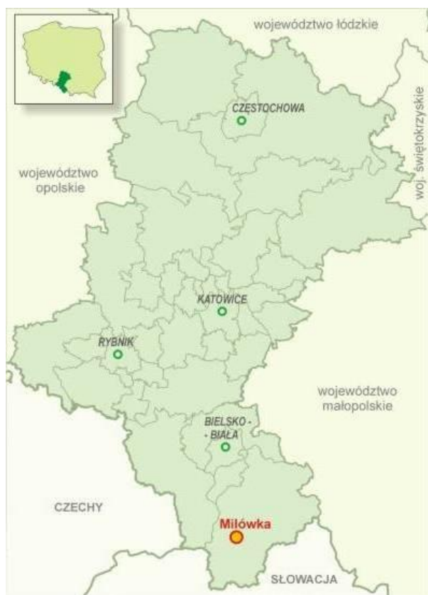
Mapa 1. Lokalizacja Gminy Milówka na tle Województwa Śląskiego